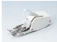
ウォーキングフット F033 / JANコード:4977766192231 2,625円