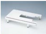
ワイドテーブル WT2 / JANコード:4977766609326 5,775円