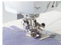
サイドカッター F054 / JANコード:4977766606011 1,890円