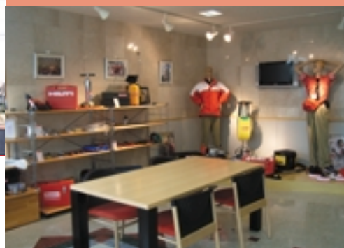
新規加盟店に渡されるツールが並ぶ本社ショールーム。