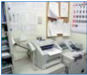
耐火金庫の上に設置されたMFC

超小型・低コストのレーザー複合機・MFCは、 店舗のユーザーにこれだけの機能を提供しています。