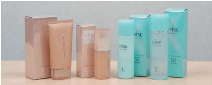
「エスト」(左)は百貨店専用的高級化粧品です。個別のお客様の肌に最良であることを目指した化粧品です。また「ソフィーナ」(右)は肌にとって本当によいものを求め、徹底した皮膚科学研究から誕生した化粧品です。

店頭システムを改良するにあたり、省スペースで接客業務の効率化を実現できるMPrintは欠かすことのできないプリンタでした。低コストで導入できたのもうれしい限りです。将来は、このプリンタの機能の一つであるBluetoothを使った無線接続を展望しています。店頭スペースをさらに効率的に活用し、お客様への接客サービスを強化するためです。その際、セキュリティ面などでも、ブラザーさんの一層の協力を期待しています。