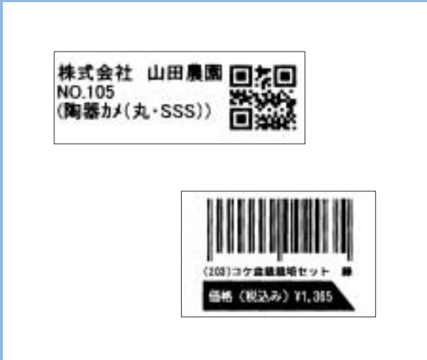
印字サンプル (原寸大)