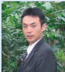
株式会社 山田農園 環境緑化事業部 ECビジネス課 課長