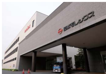
日本モレックス様の本社。営業・製品開発・製造の各本部を中心に、生産技術部門、品質保証部門、金型の設計・製造部門を集約し、お客様のニーズに迅速に対応できる体制を整えています。