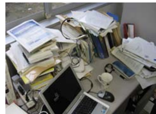
机上で散乱する紙資料