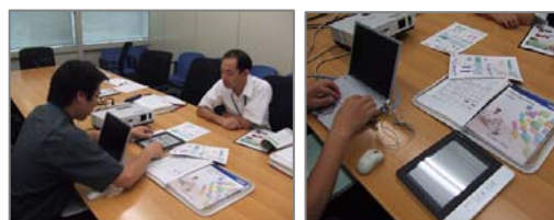
情報の共有も可能